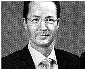
Lambert T. Koch ist Rektor der Bergischen Universität Wuppertal

Vieles spricht dafür, dass die Zukunft der deutschen Universität nur erfolgreich werden kann, wenn man wieder mehr dem Prinzip der Subsidiarität folgt. Nach diesem Prinzip sollte nur so viel auf höhere Regelungsebenen verlagert werden, wie Zielen und Zwecken – in diesem Fall jenen der Wissenschaft – zugutekommt. In der Umsetzung dieses Postulats müssen sich aus vielerlei Gründen nicht zuletzt auch Wissenschaft und Wirtschaft in einer vernünftigen Weise begegnen können. Hetzkampagnen gegen Unternehmerisches und Ökonomisches im Hochschulbereich helfen dabei wenig.